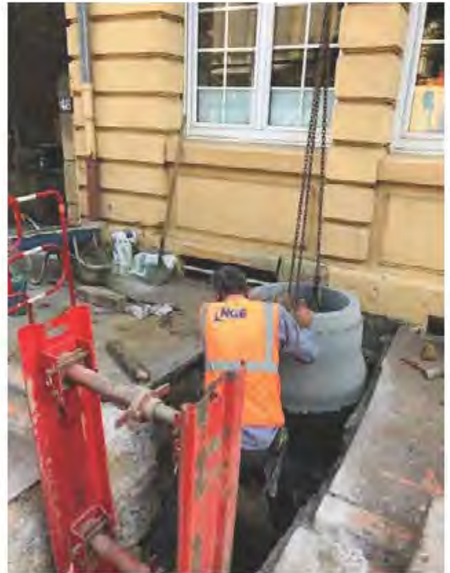
↻ ↻ Travaux d'assainissement rue de la République et à l'école Schuman.